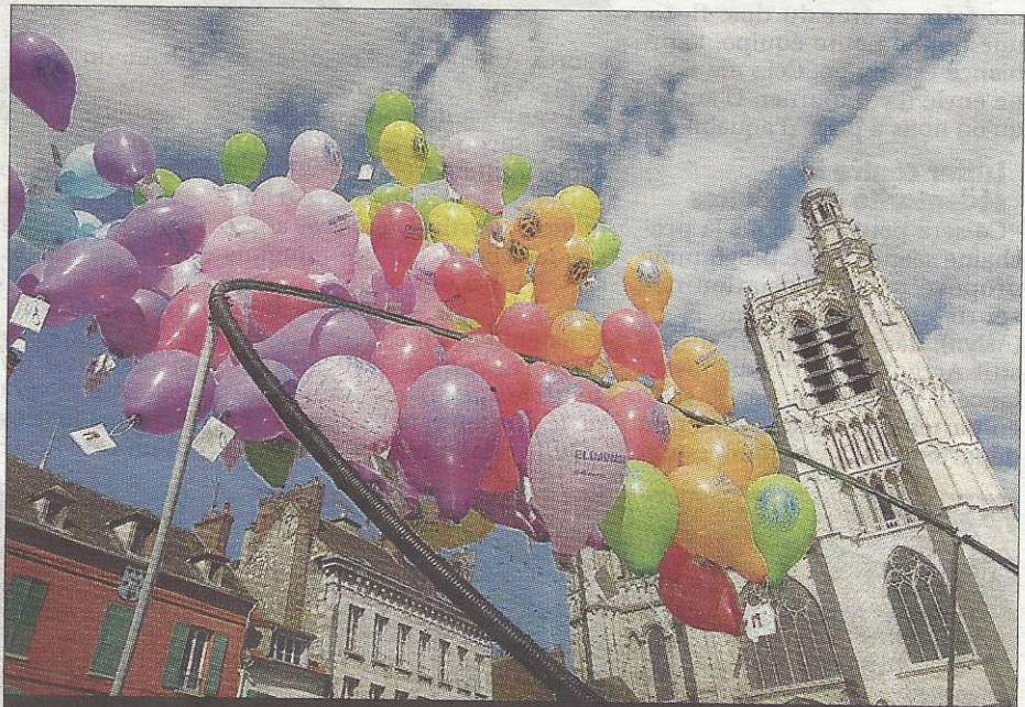
ENVOL. Près de 700 ballons colorés se sont envolés de la place de la cathédrale, samedi.

« De plus, les cartes des ballons qui seront retour-